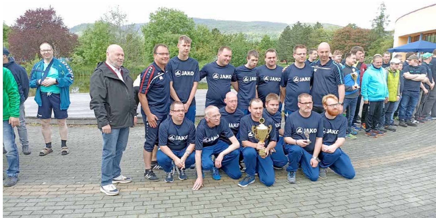
Die Nordthüringer Werkstätten sind Landesmeister 2023.