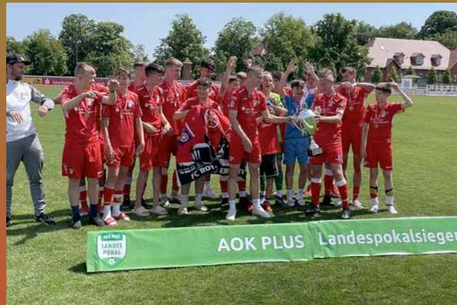
C-Junioren FC Rot-Weiß Erfurt