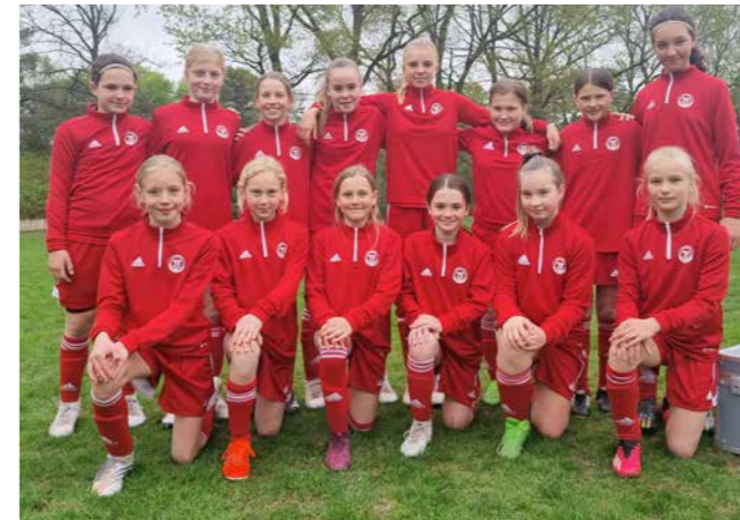
U12-Juniorinnen in Berlin.

Im Abschlussspiel gegen Südbaden zeigte die Mannschaft, so wie beim NOFV-Turnier vor wenigen Wochen, was in ihr steckt. Der TFV-Trainer, der die Spieler schon einige Jahre kennt, wörtlich: „Hier muss ich den Jungs ein Kompliment machen. Sie haben vom Kampf, Einsatz und Willen her alles geboten und damit gezeigt, was in ihnen steckt.“