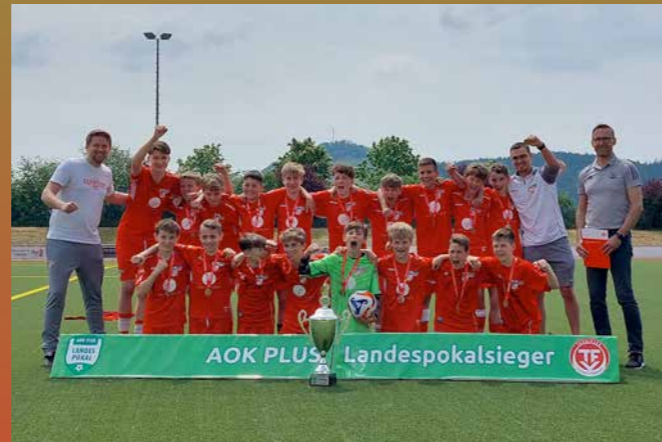
D-Junioren FC Rot-Weiß Erfurt