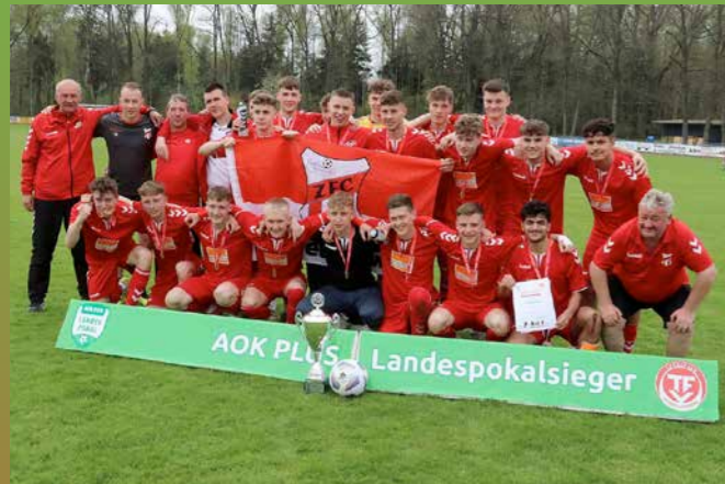
A-Junioren ZFC Meuselwitz