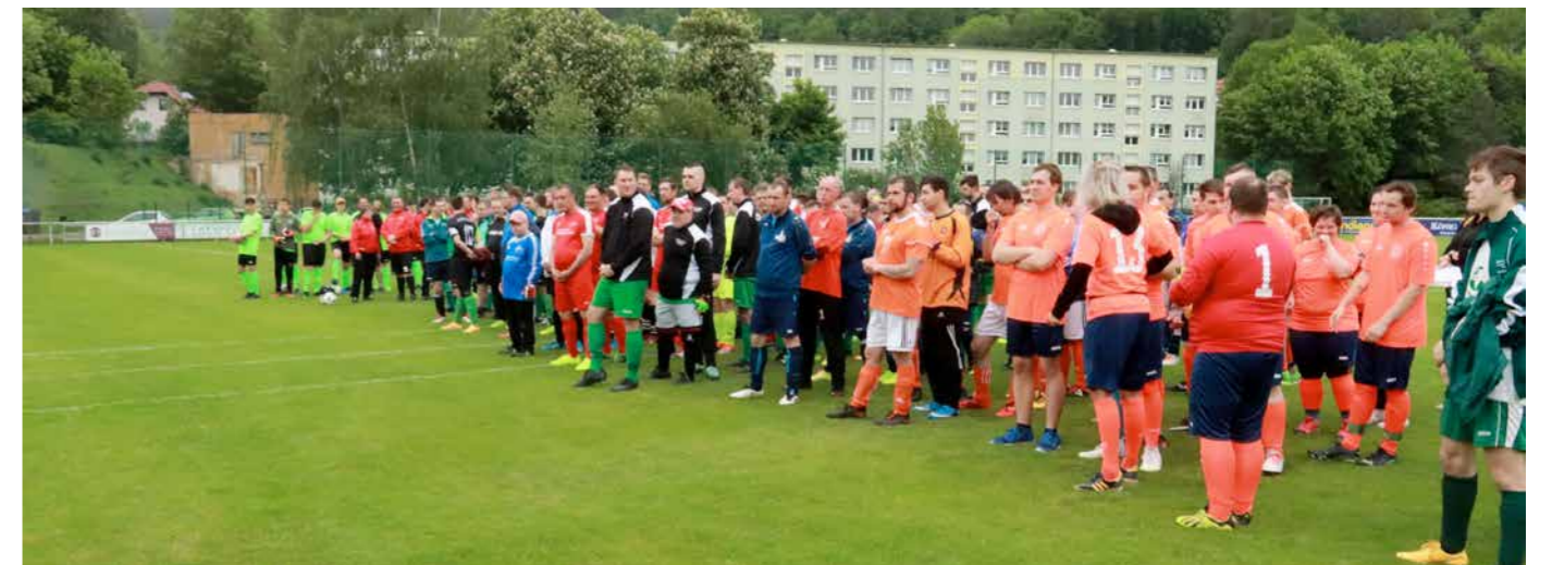
13 Mannschaften aus ganz Thüringen kamen in Bad Blankenburg zusammen.