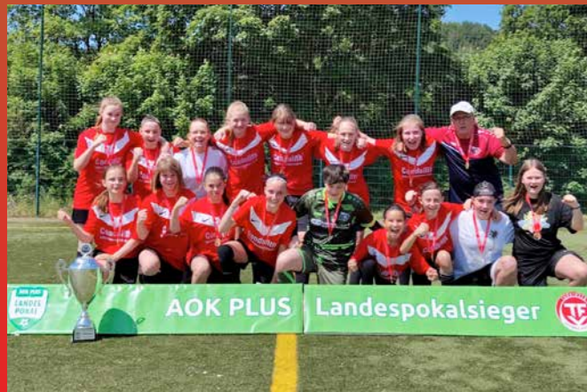
C-Juniorinnen ESV Lok Meiningen