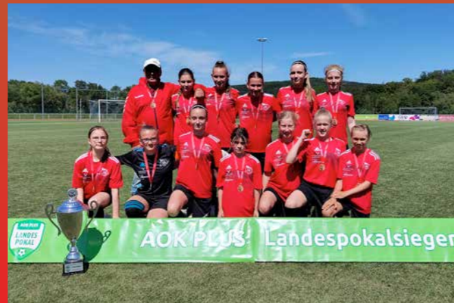
D-Juniorinnen ESV Lok Meiningen