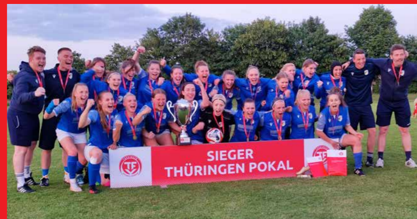
Frauen FC Carl Zeiss Jena II

Der Thüringer Fußball-Verband gratuliert allen Siegern recht herzlich und wünscht weiterhin beste sportliche Erfolge.