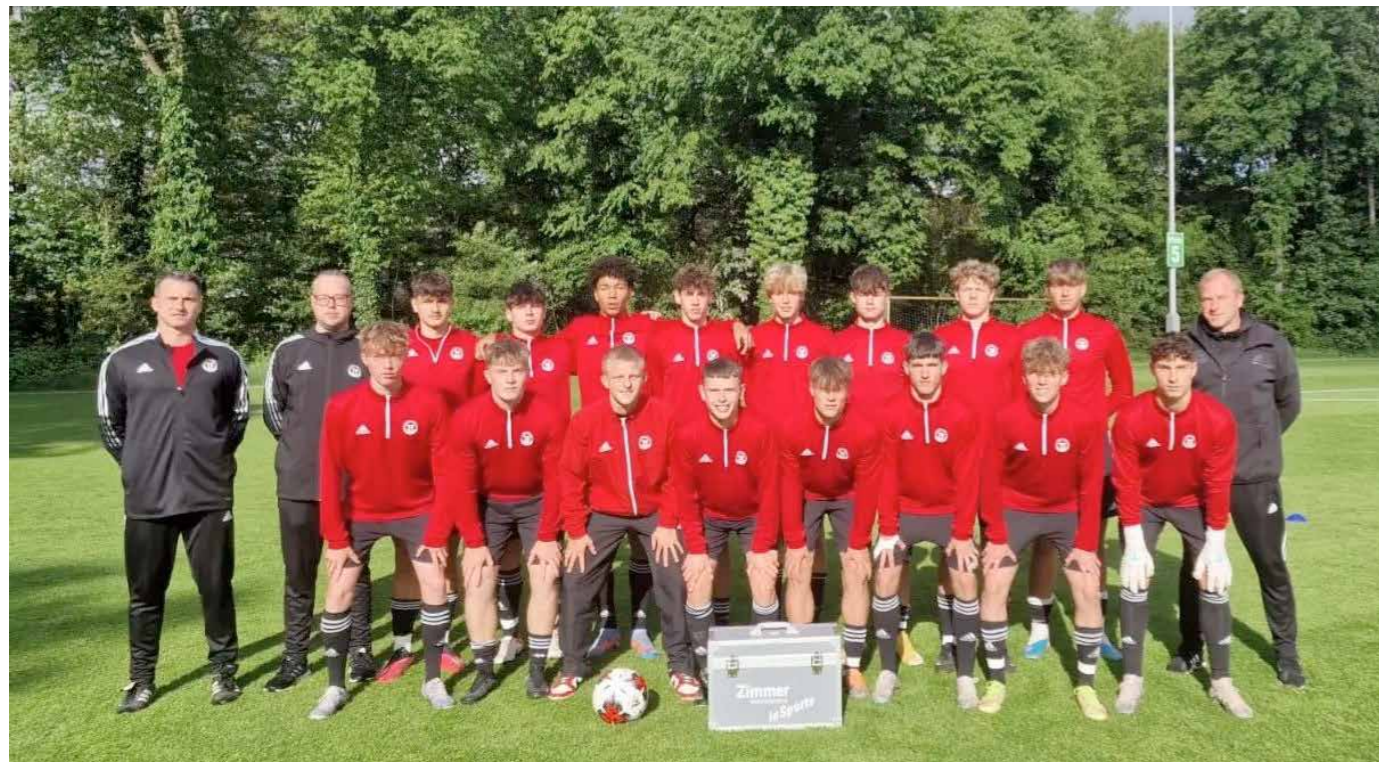
U16-Junioren in Duisburg.

Die U16-Landesauswahl weilte vom 12.-17. Mai zum DFB-Sichtungsturnier in der Sportschule Duisburg/Wedau. Alles in allem war es ein durchwachsendes Turnier unserer Mannschaft mit einem versöhnlichen Abschluss und einer entsprechenden Platzierung. Am Ende stand Platz 17 von 22 teilnehmenden Mannschaften zu Papier.