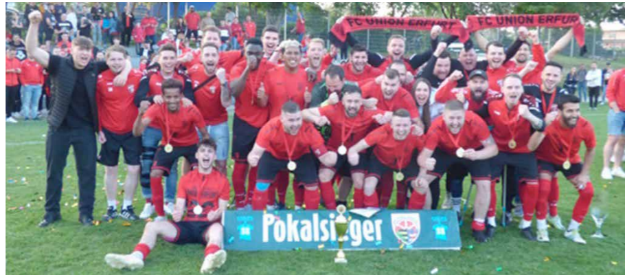
Der KFA Erfurt-Sömmerda gratuliert dem FC Union Erfurt und wünscht viel Erfolg bei der Teilnahme am Landespokal.

In einem lange spannenden Spiel gelang dem hohen Favorit Union Erfurt am Ende verdient der Kabine38 Kreispokalsieg gegen die zwei Ligen tiefer spielenden Kreisklasse-Kicker von Gispersleben III. Die knapp 700 zahlenden Zuschauer sahen bei sehr guten äußeren Bedingungen eine Partie, welche etwas überraschend lange offen war. Am Ende konnten aber beide Mannschaften jubeln, die Sportfreunde von Union Erfurt über den Sieg im Kreispokal und die Kicker von Gispersleben III über die großartige Leistung. Die stets faire Partie wurde souverän und unauffällig vom Sportfreund Sascha Spinnler aus Ermstedt geleitet. In der Halb-