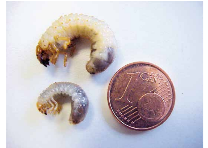
Durch Wurzelfraß verursachen die Larven des Junikäfers (oben) und Gartenlaubkäfers (unten) enorme Schäden an Rasenflächen.

Bekommt der Rasen braune Stellen und lässt sich leicht vom Boden lösen, können Rasenschädlinge die Ursache sein. In den letzten Jahren kam es hierdurch auf vielen Rasenflächen in Deutschland zu massiven Schäden. Auch Fußballplätze waren davon betroffen. Dabei sind es nicht die Käfer selbst, die den Schaden anrichten, sondern es sind deren Larven, die die Gräser schädigen. Die häufigsten Schädlinge auf Sportrasenflächen sind Engerlinge, Tipula-Larven und Erdräupen. Die Larven der Schadinsekten befinden sich unter der Grasnarbe und fressen unter anderem an den feinen Wurzeln der Rasengräser. In der Folge kann diese leicht und großflächig abgezogen werden. Sie ist nicht mehr schersfest, kaum belastbar und vertrocknet schnell. Sehr häufig wird der Rasen auch durch Vögel oder Wildschweine auf der Suche nach den Larven regelrecht umgegraben. Langfristige Spielausfälle sind die Folge.