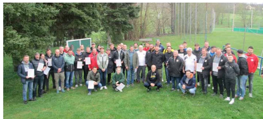
50 Teilnehmer und Teilnehmerinnen konnten den Lehrgang erfolgreich abschließen.