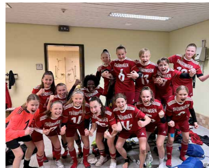
U16-Juniorinnen in Duisburg.

Für die Jahrgänge 2009 & 2010 standen in den letzten Monaten einige Auswahlaktivitäten auf dem Programm. Im Fokus standen vor allem das NOFV-Regionaltturnier in Lindow sowie das DFB-Sichtungsturnier in Duisburg. Landestrainer Marc Reinhardt: „Die Ergebnisse der Spiele waren nicht immer zufrieden stellend, aber das entscheidende sind die Leistungen der einzelnen Spielerinnen.“ Vier Spielerinnen haben die Sichter und Sichterinnen des DFB überzeugt und können sich auf eine Einladung des DFB zu einen der beiden DFB-Lehrgängen im Juli freuen. „Dies ist ein tolles Ergebnis für uns als kleineren Landesverband und eine Bestätigung der Arbeit des TFV im Bereich der Talentförderung.“ Im Rahmen des Turniers hatten die Spielerinnen die Möglichkeit das DFB-Pokalfinale der Frauen in Köln zu besuchen.