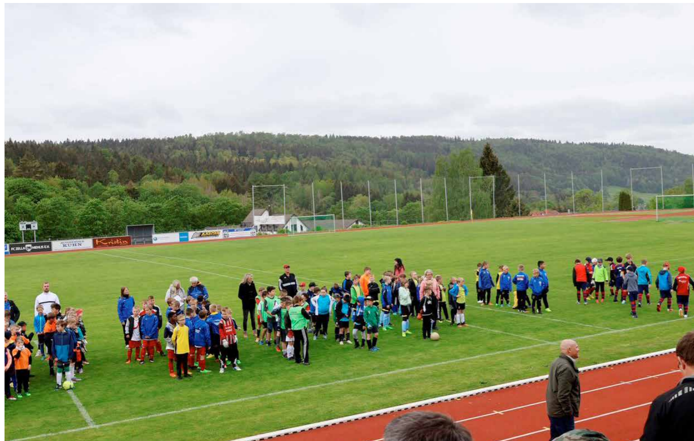
Mehr als 200 Kinder nahmen am Grundschul-Fußballturnier in Zella-Mehlis teil.

Am 24. Mai war es wieder soweit: bei der inzwischen schon 15. Auflage des Grundschul-Fußballturniers „Der Junge mit der Deutschlandfahne“ versprühten mehr als 200 Kinder aus den Landkreisen Schmalkalden-Meiningen und Rhön-Grabfeld jede Menge Spaß und Spielfreude. Mit guter Laune und gutklassigem Kinderfußball begeisterten die Jungs und Mädels einmal mehr ihre zahlreich vertretenen Lehrer, Betreuer und Zuschauer. Der Siegerpokal ging nach zwei engen Finalpartien sowohl in der Klassenstufe 1/2 (Malbach-Grundschule Mellrichstadt) als auch in der Klassenstufe 3/4 (Grundschule Sulzfeld) jeweils nach Bayern.