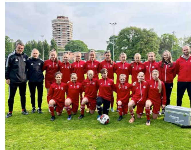
U14-Juniorinnen in Duisburg.

Nach verschiedenen Sichtsmaßnahmen und Leistungsvergleichen fand für die U12-Juniorinnen der erste Gemeinschaftslehrgang statt. Das Team war zu Gast beim Berliner Fußball-Verband an der Sportschule Wannsee und bestritt ein Kinderfußball-Turnier sowie ein Spiel, welches die Thüringer Auswahl für sich entscheiden konnte.