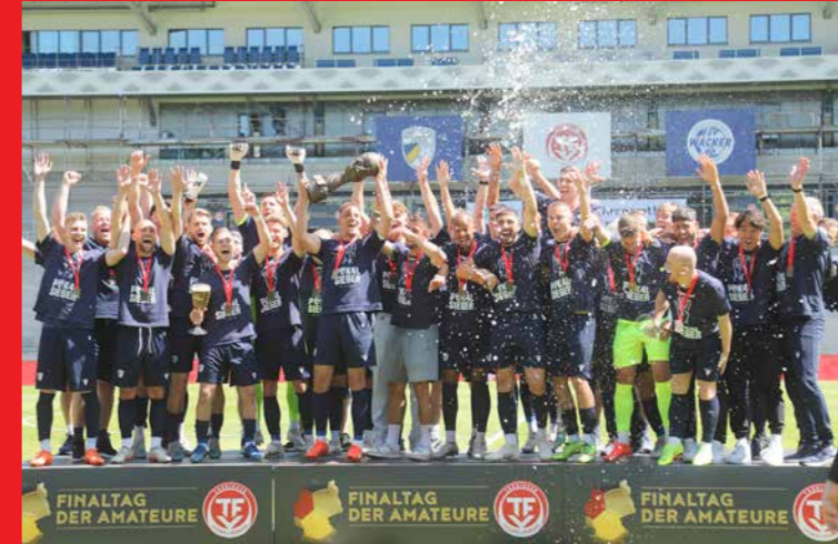
Herren FC Carl Zeiss Jena

Der Thüringer Fußball-Verband gratuliert allen Siegern recht herzlich und wünscht weiterhin beste sportliche Erfolge.