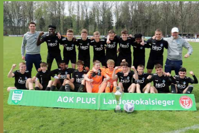
B-Junioren 1. FC Eichsfeld