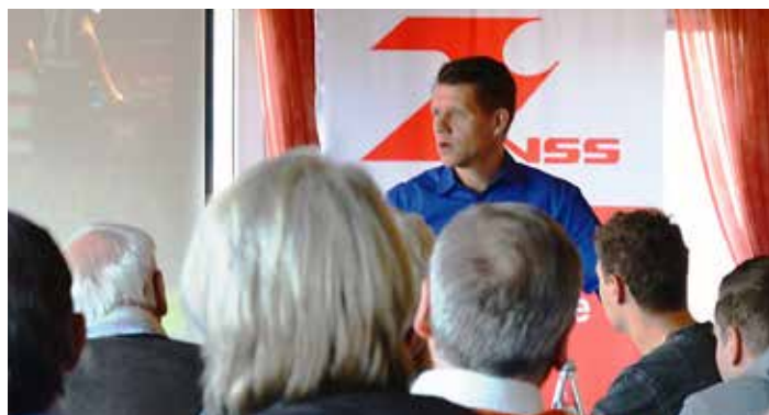
Bundesliga-Schiedsrichter Patrick Ittrich zu Besuch in Bozen.

Ein wichtiger Punkt war zudem das richtige Verhalten des Schiedsrichters, um unpopuläre Situationen auf dem Spielfeld so gut wie möglich zu vermeiden.