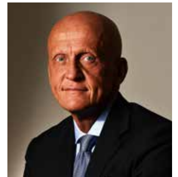
Pierluigi Collina übernimmt auch bei der FIFA Verantwortung.

Als aktiver Schiedsrichter hatte Collina zu den Besten seiner Zeit gehört und war zwischen 1998 und 2003 sechsmal in Folge zum „Welt-Schiedsrichter des Jahres“ gewählt worden.