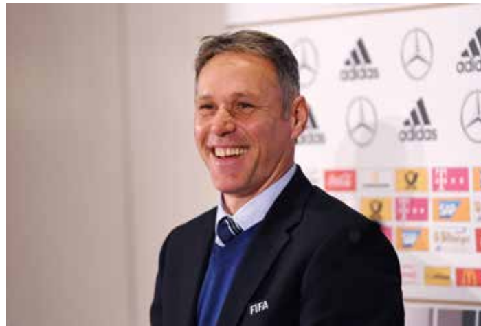
Marco van Basten sorgte während der Winterpause mit seinen Ideen für Gesprächsstoff.

Shoot-Outs sind aus dem Hockey bekannt. Sie seien spektakulär für die Zuschauer und interessant für den Spieler, so van Basten. Der Niederländer beschreibt den Ablauf so: „Jede Mannschaft hat fünf Versuche: Der Schiedsrichter pfeift, dann läuft der