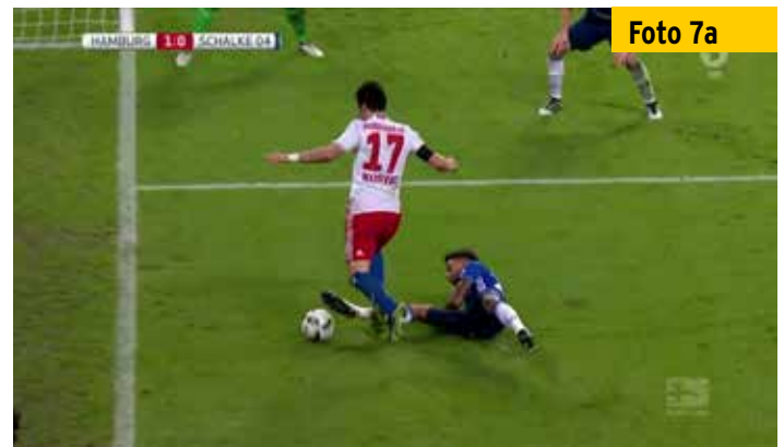
Mit dem rechten, etwas hochgezogenen Bein wird die Nr. 17 gefoult.

Eine neue Art von Fouls, auf die sich die Schiedsrichter einstellen müssen. In allen Spielklassen, denn die Bundesliga-Spieler dienen ja als Vorbild, wenn auch leider manchmal als schlechtes.