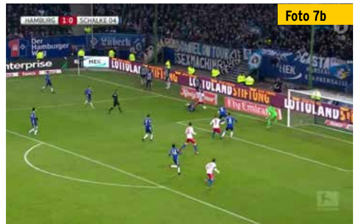
Der Schiedsrichter ist ganz dicht an dem brisanten Vorgang dran.