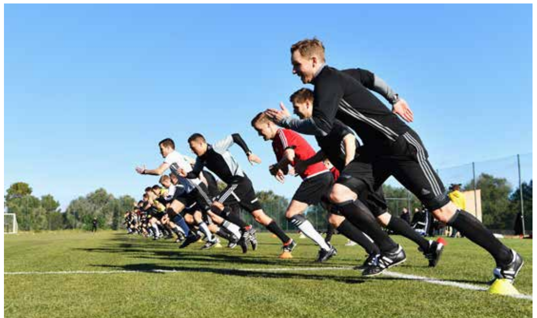
Etwa die Hälfte des Programms auf Mallorca bestand aus Sporteinheiten.

Dass zwei Schiedsrichter-Leistungen an den letzten Spieltagen