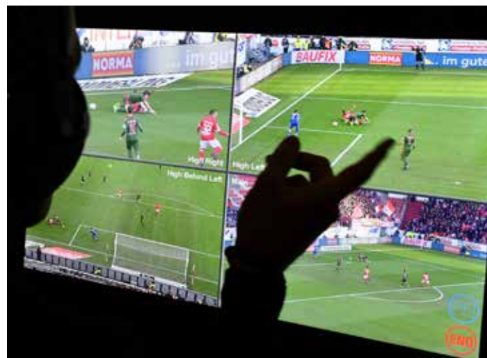
Innerhalb weniger Sekunden lässt sich die gleiche Szene aus verschiedenen Perspektiven am Bildschirm analysieren.