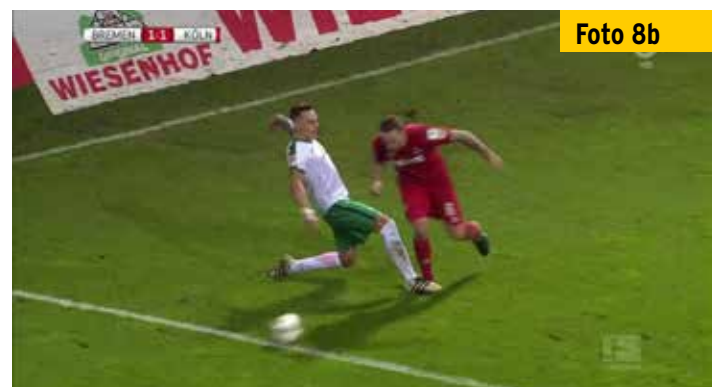
...ist der kurze Tritt direkt auf den Fuß in der Geschwindigkeit des Spiels nicht einfach zu erkennen.