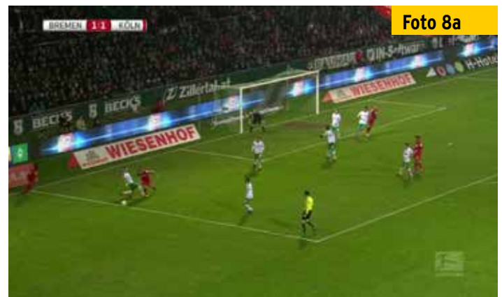
Trotz des freien Blicks auf die Szene im Bremer Strafraum...