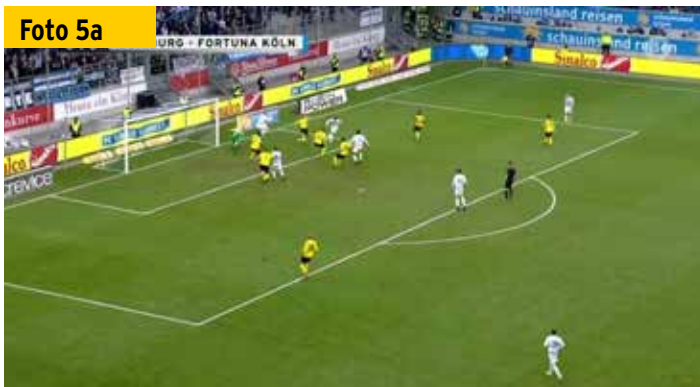
Der Schiedsrichter schaut von der Strafraumgrenze auf eine ziemlich „zugestellte“ Szene.