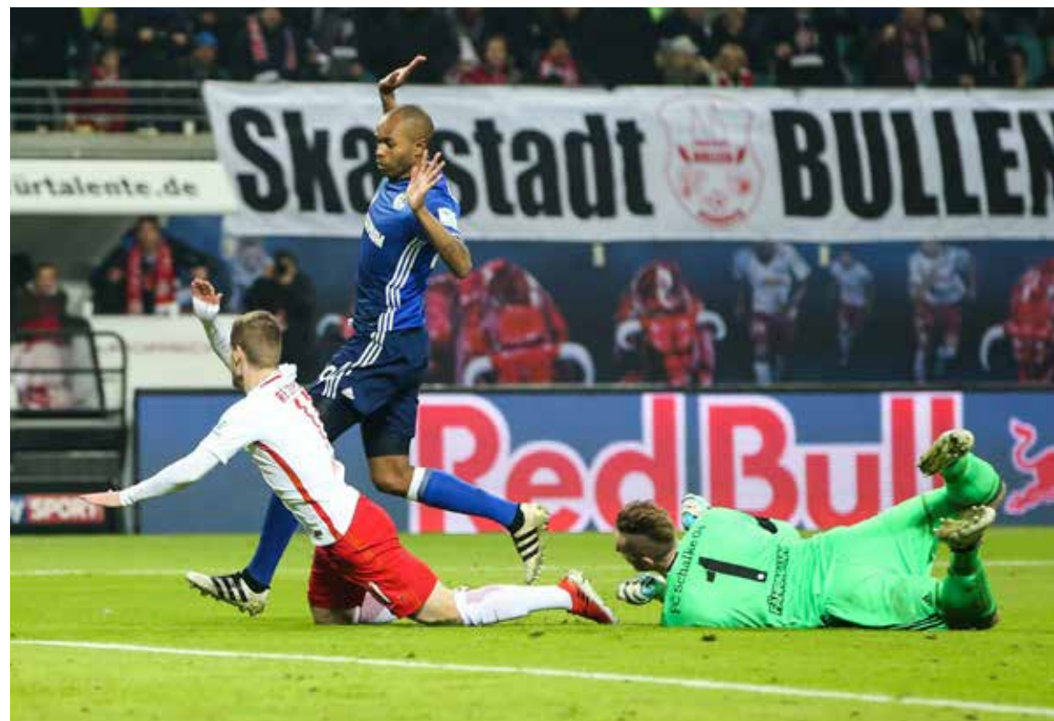
Der klassische Fall einer Unsportlichkeit: Timo Werner holt mit einer „Schwalbe“ einen Strafstoß für sein Team heraus.

Als ein ebenso schlechtes Vorbild zeigte sich in dieser Saison beispielsweise auch schon Marcel Schmelzer von Borussia Dortmund. In der Schlussphase des Spiels gegen Eintracht Frankfurt lief der Borusse auf Schiedsrichter Wolfgang Stark zu und rempelte ihn so heftig, dass dieser fast zu Boden ging.