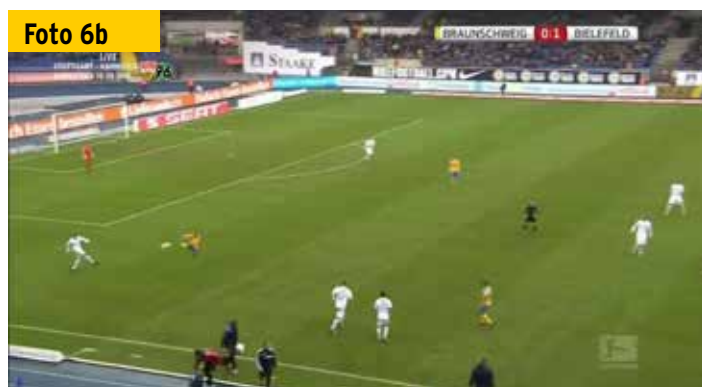
Der Vierte Offizielle (Dritter von links außerhalb des Spielfelds) hat sich abgedreht.