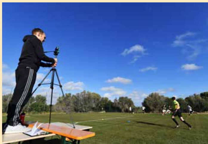
Beim Abseits-Stresstest wurden schwierige Situationen für die Assistenten simuliert.