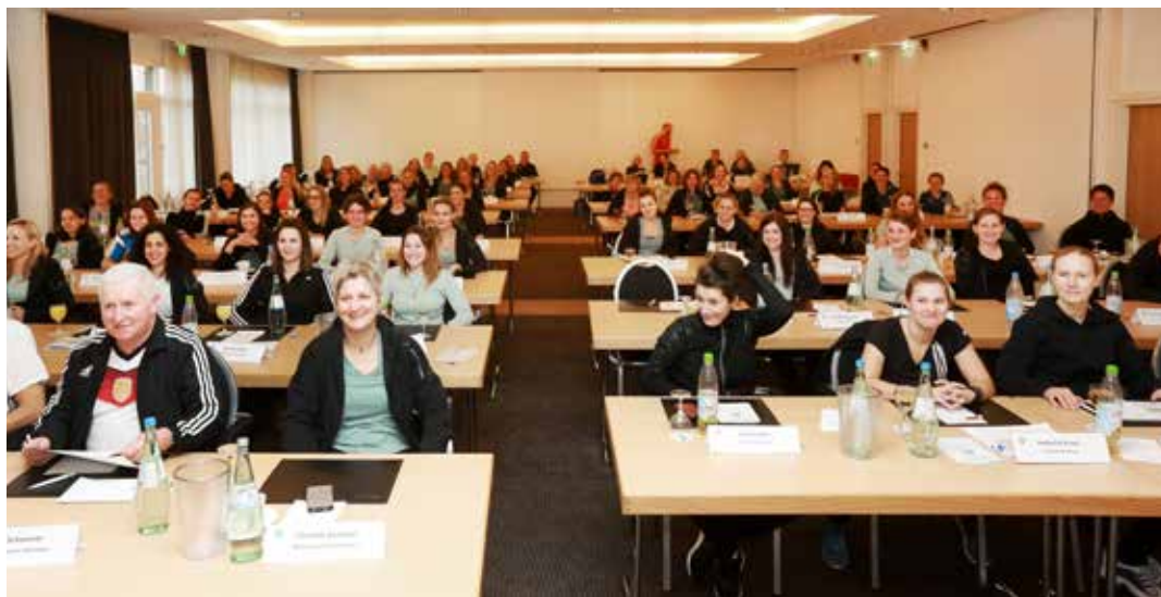
Gut besetzter Konferenzraum: Deutschlands Spitzen-Schiedsrichterinnen bei ihrer Halbzeit-Tagung in Mainz.