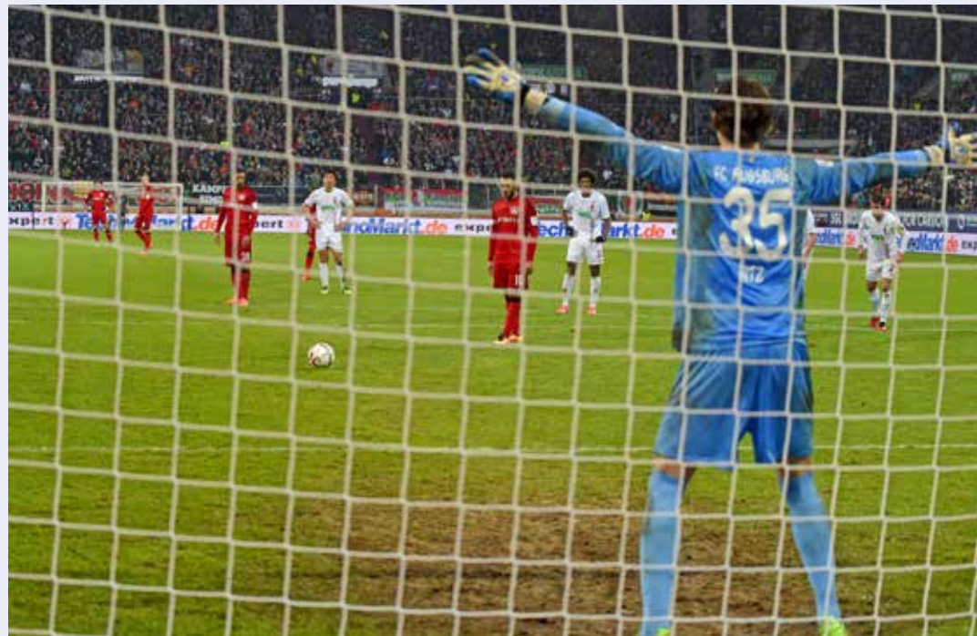
So lange der Torhüter vor der Strafstoß-Ausführung auf seiner Linie bleibt, darf er sich dort seitlich aber nicht nach vorne bewegen (Situation 10).

Tor, Anstoß. Gemäß der Regeländerung zu Beginn dieser Saison ist der Treffer anzuerkennen, auch wenn der Ball auf dem Weg ins Tor