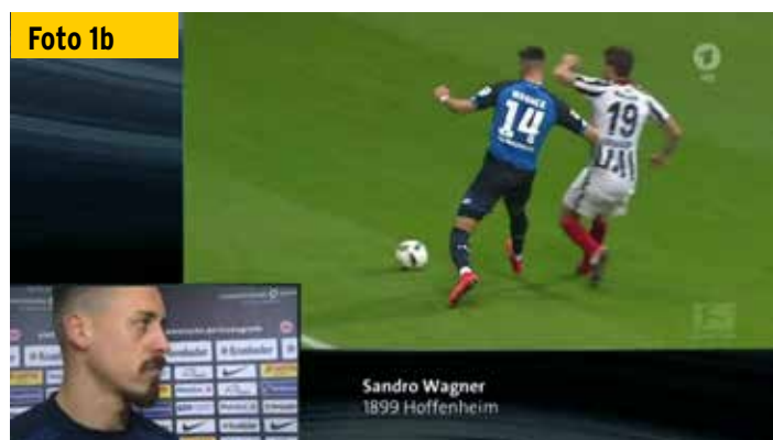
Foto 1b Aus anderer Sicht: Während Wagner seinen Arm in Körperhöhe einsetzt, zielt Abraham auf den Kopf des Gegners.

der etwas besseren Position, als der Frankfurter von der Seite kommt und ihn mit dem linken Arm, den er hoch erhoben, seitlich abgespreizt und im Ellenbogengelenk gebeugt hat, gegen den Kopf schlägt ( Fotos 1a und b ).