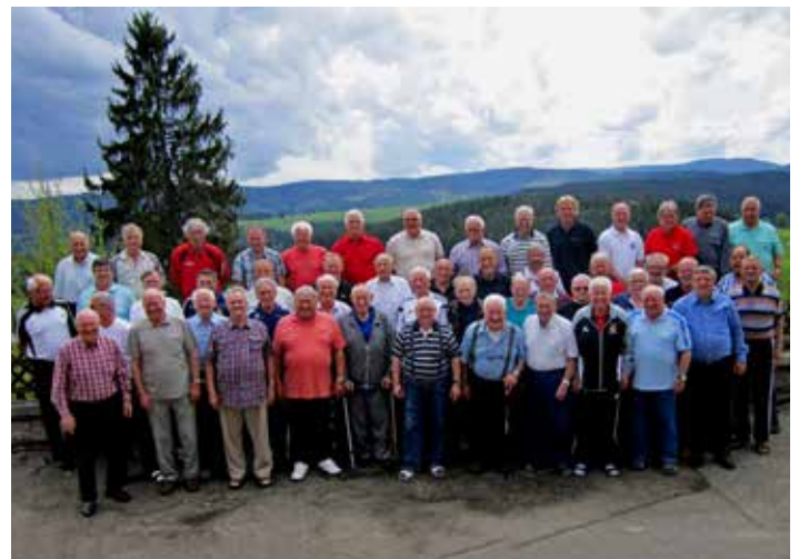
Während des Lehrgangs in Saig stellten sich die Schiedsrichter-Senioren den Fotografen.