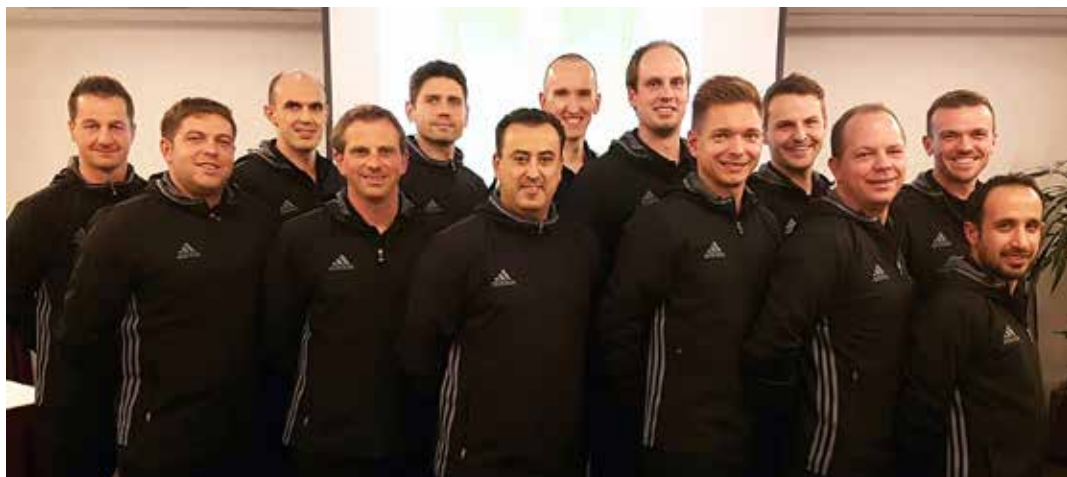
Die DFB-Futsal-Schiedsrichter bei ihrem jährlichen Lehrgang in Hamburg.

Der Verband hat seinen Zuschuss von zwölf auf 14 Millionen Euro erhöht und hofft, so die Leistung der französischen Unparteiischen, die international zuletzt kaum eine Rolle gespielt haben, durch die erhöhten Zuwendungen zu verbessern. Demnächst soll es zudem 18 statt bisher elf Elite-Schiedsrichter geben.