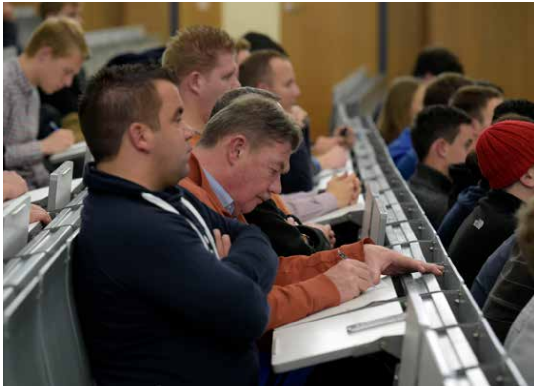
Im bunt gemischten Plenum saßen Schiedsrichter, Funktionäre, Juristen und Fußball-Interessierte.