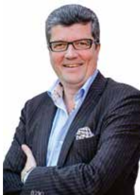
Herbert Fandel, Vorsitzender des DFB-Schiedsrichter- Ausschusses

Anspannung und Entspannung müssen dabei in einem vernünftigen Verhältnis zueinander stehen.