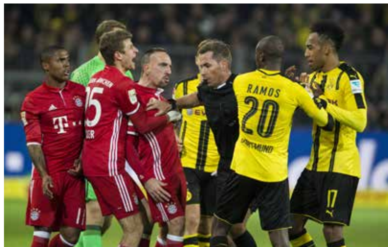
Ein Schiedsrichter mit Persönlichkeit zeigt auf dem Platz die notwendige Konsequenz und den erforderlichen Mut - wie Tobias Stieler beim Bundesliga-Spitzenpiel zwischen Borussia Dortmund und Bayern München im November 2016.

Die Schiedsrichter-Ausbildung und die Einsätze auf dem grünen Rasen stärken junge Menschen dann nicht nur als Unparteiische. Auch beim Auftreten in der Schule und später im Beruf gewinnen sie an Sicherheit.