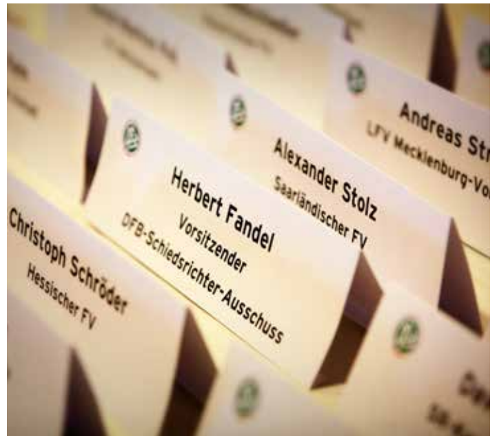
Mehr als 70 Teilnehmer trafen sich zum gemeinsamen Lehrgang in Frankfurt am Main.

In den Anwärter-Lehrgängen müsse konsequent Wert auf die Einbindung der Gewaltprävention gelegt werden. Junge Schiedsrichter müssten früh darauf hingewiesen werden, dass so etwas vorkommen kann. Dabei sollten Lehrwarte auch mögliche Handlungsmöglichkeiten aufzeigen: Wie gehe ich damit um? Welche Möglichkeiten habe ich? Wo bekomme ich Hilfe? „Um eine gewisse Nachhaltigkeit zu erzie-