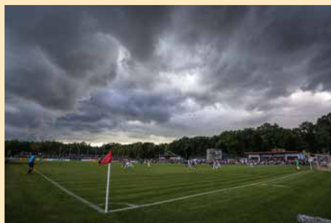
Zieht ein Gewitter auf, dann muss der Schiedsrichter diese Gefahr ernst nehmen.

Aber: Der Unparteiische hat in diesem Beispiel auch alles falsch gemacht, was er falsch machen konnte. Jan F. Orth: „Für eine strafrechtliche Haftung muss es schon wirklich ‚dicke kommen‘ und der amtierende Schiedsrichter ganz elementare Pflichten vernachlässigen.“