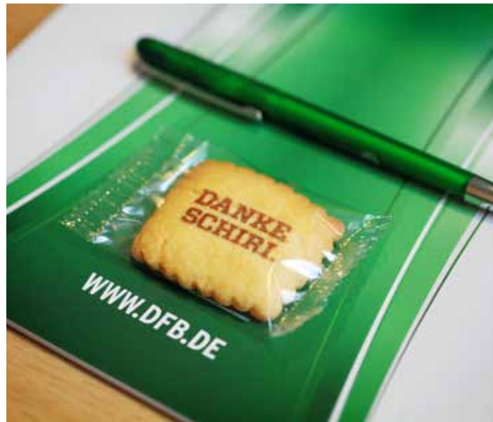
Die zentrale Bundesveranstaltung für „Danke Schiri.“ findet 2017 in Leipzig statt.

Die vielfach kritisierten Materialien wurden für die Fortsetzung von „Danke Schiri.“ grundlegend von der durch den DFB beauftragten Agentur überarbeitet. Lag bei der letzten Aktion deren Fokus auf der Organisation der