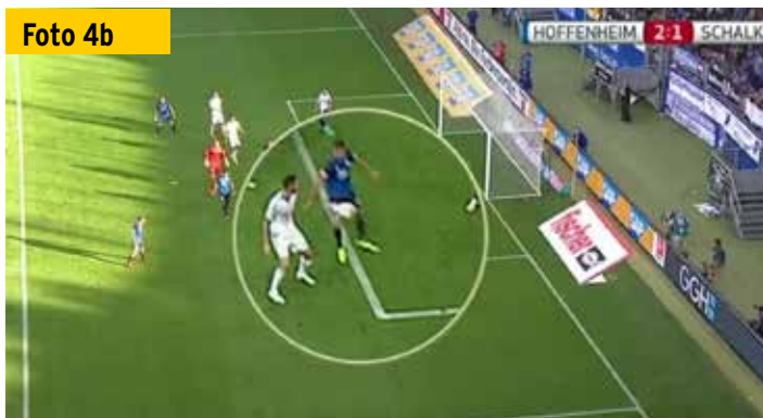
...oder hat der Hoffenheimer sich Richtung Ball „gelehnt“, um die Flanke regelwidrig abzufangen?