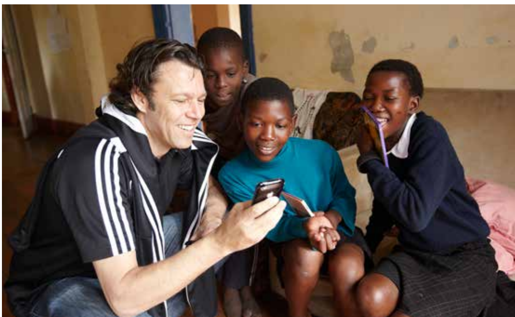
Der ehemalige FIFA-Schiedsrichter Urs Meier wurde für sein Engagement als Botschafter für die Kindernothilfe ausgezeichnet.