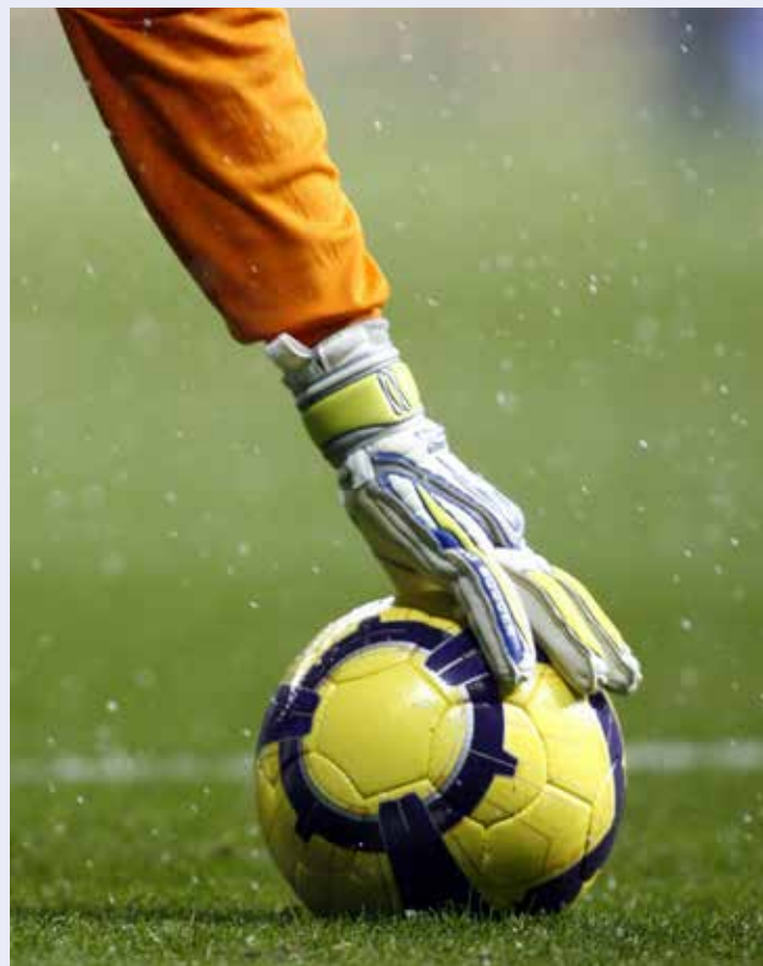
Hat der Torwart eine Hand am Ball, darf dieser nicht mehr vom Stürmer gespielt werden (Situation 13).

Nein. Der Team-Offizielle darf sich jederzeit aus dem Innenraum entfernen. Lediglich während des Aufenthalts im Innenraum ist das Geben von Anweisungen unter Beachtung verschiedener