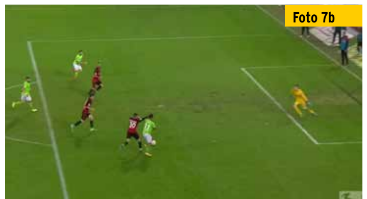
...er aber nur durch einen Griff an die Schulter seines Gegenspielers vereiteln kann.