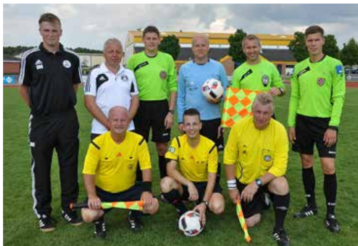
Das deutsch-polnische Schiedsrichter-Team beim 16. Pomerania Cup.